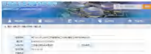
关于 2023 年上半年江苏省建筑施工标准化星级工地项目名单的公告

根据《省住房城乡建设厅关于公布 2023 年上半年江苏省建筑施工标准化星级工地项目名单的公告》（苏建质安〔2023〕449 号）和《省住房城乡建设厅关于公布 2023 年上半年江苏省建筑施工标准化星级工地项目名单的公告》（苏建质安〔2023〕449 号）要求，经江苏省住房和城乡建设厅（江苏省住房和城乡建设厅）组织专家对全省建筑施工安全生产标准化工作、文明施工管理、扬尘防控、安全生产标准化、文明施工管理、扬尘防控等工作，进一步落实企业安全生产主体责任，经综合评审，拟将 2023 年上半年江苏省建筑施工标准化星级工地项目名单公布如下（见附件）。