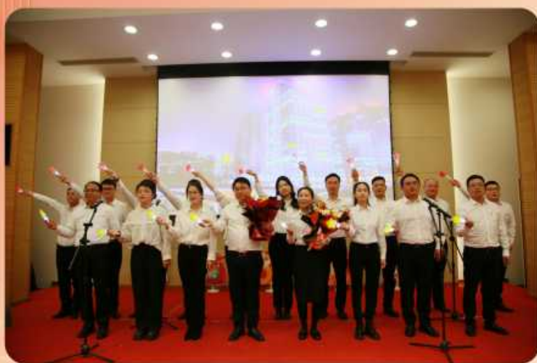
党员代表合唱《早安，中国》